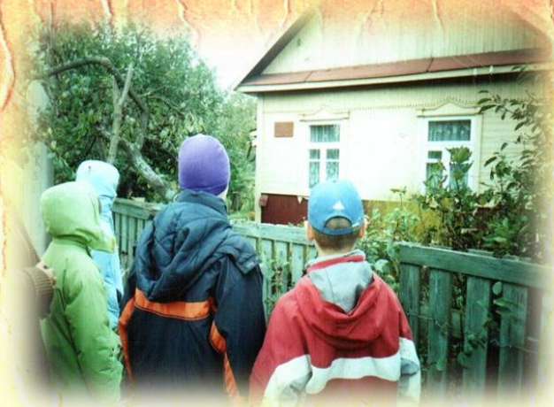
У памятной доски на улице Леонида Бачилы